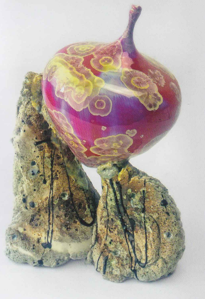
Ricus Sebes, linksboven: Schaal , 2021; porselein, chamotte, kristalglazuur; h. 9 x 24 x 21 cm | linksonder: Container , 2020; porselein, chamotte, kristalglazuur; h. 12 cm, Ø 34 cm | rechts: Amphora , 2020; porselein, chamotte, kristalglazuur; h. 22 x 19 x 10 cm