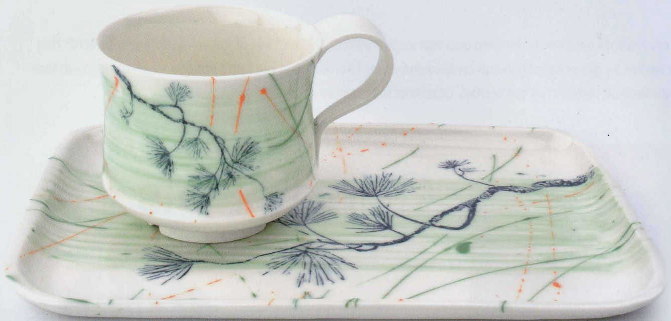
Sonja Sebes, Theeset Pijnboom , 2021; porselein, engobe; plateau 17 x 26 cm, kopje h. 12 cm, Ø 8 cm